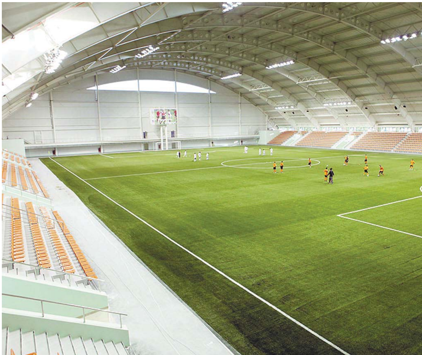
Огнезащита крытого футбольного манежа «Урал» в Екатеринбурге