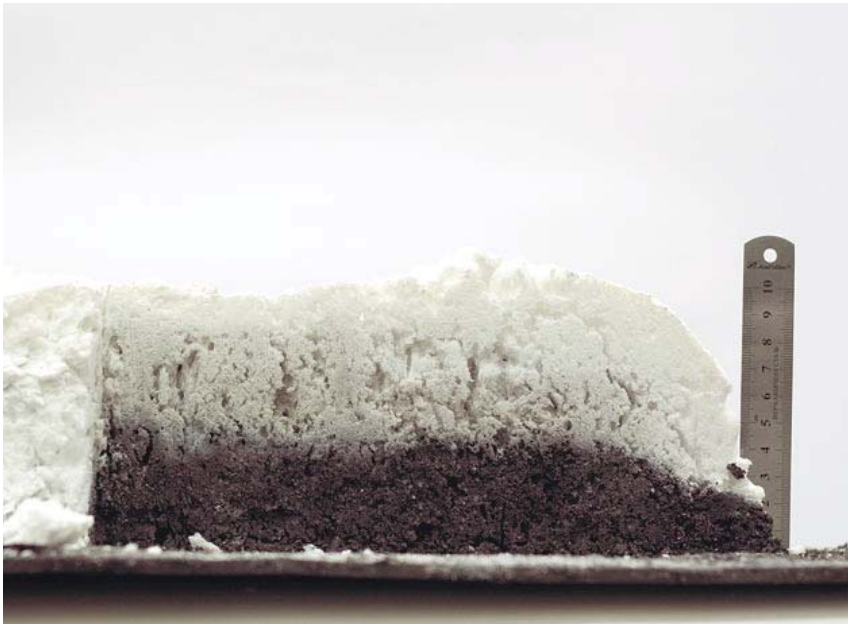
Теплоизолирующий слой огнезащитного покрытия после воздействия высоких температур

конструктивной огнезащитой – весьма трудоемкая работа. Кроме того, преимуществами огнезащитных ЛКМ остаются: ремонтпригодность, декоративность, широкие эксплуатационные характеристики – возможность применять как в открытых, так и в закрытых помещениях, в условиях широкого диапазона температур и под воздействием различных производственных факторов.