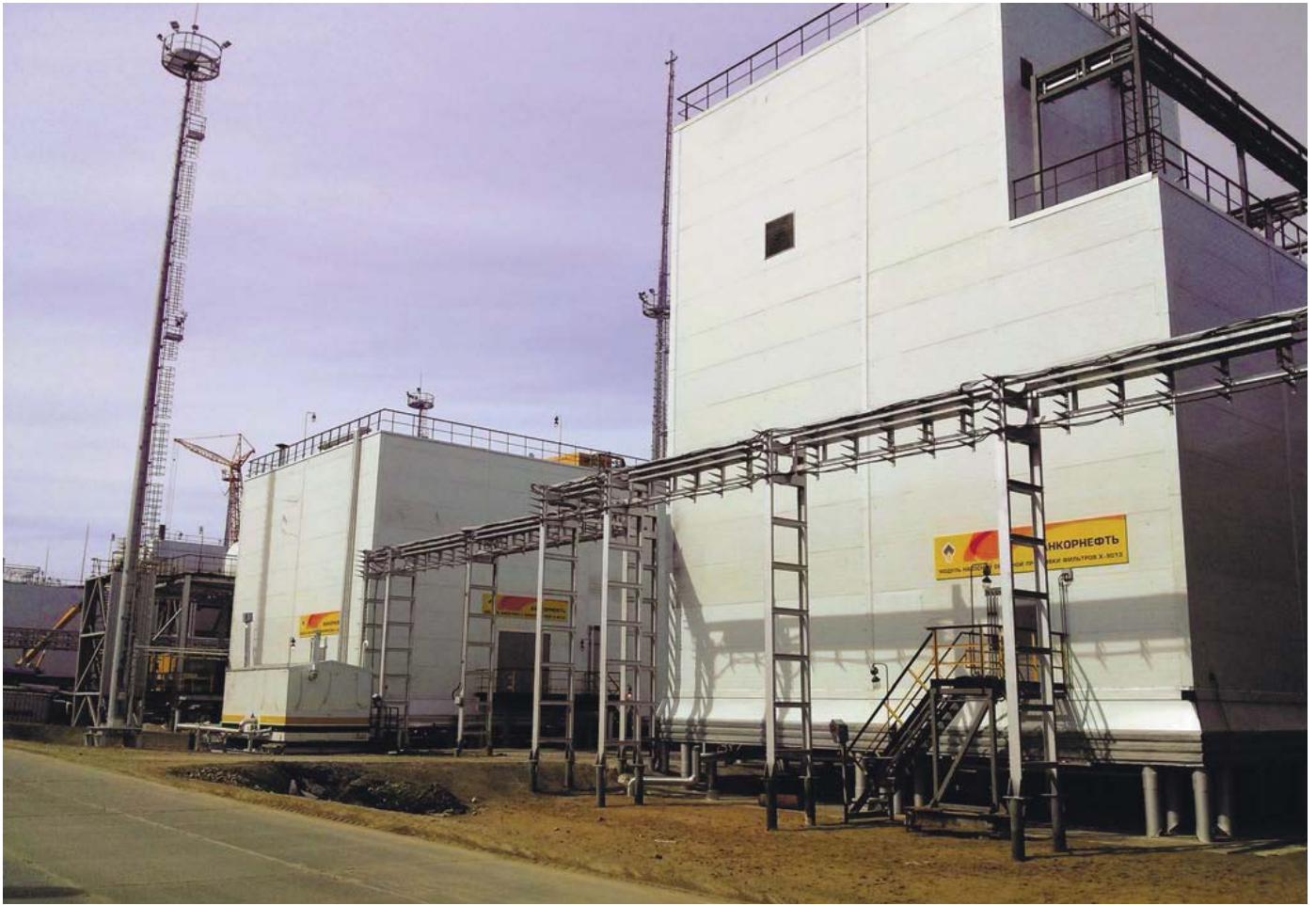
АКЗ и огнезащита объектов Ванкорского нефтегазового месторождения в Красноярском крае

и материалы проходят контроль качества, оборудование соответствует установленным требованиям, при продаже материалов правильно применяется нормативная база, то принципиальных отличий нет. Контроль на всех этапах производства и нанесения материалов, а также выполнение норм пожарной безопасности дают гарантию получения качественного покрытия.