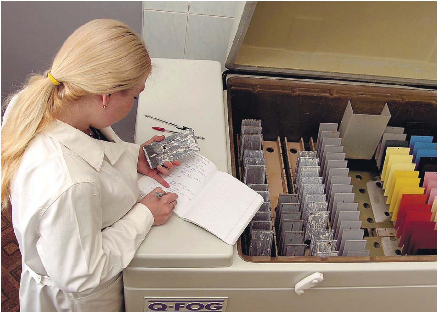
Лаборатория холдинга «ВМП». Испытания в камере соляного тумана

с этим явлением в настоящий момент – это просветительская работа с потребителями и усиление контроля со стороны надзорных органов.